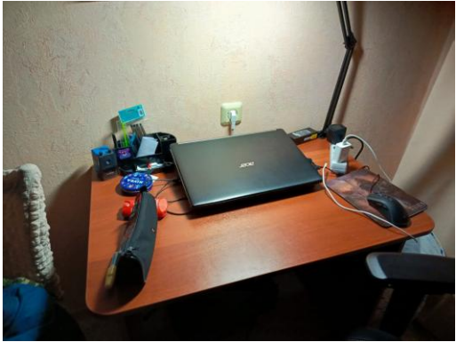
Мое рабочее место до использования 5С