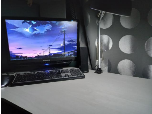
Мое рабочее место до использования 5С