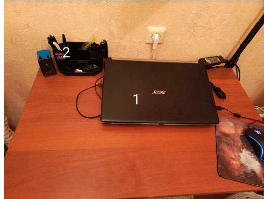
Мое рабочее место после использования 5С