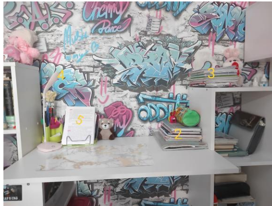
Мое рабочее место после использования 5С

Рабочий стол: 1 письменные принадлежности , 2.учебники, 3. тетради, 4. лампа для освещения , 5. расписание уроков.