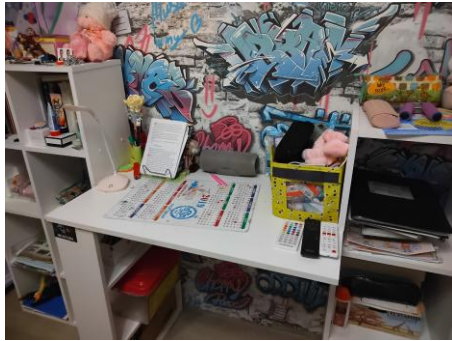
Мое рабочее место до использования 5С