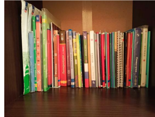
Моя книжная полка после использования 5С

Рабочий стол: 1 ноутбук, 2. письменные принадлежности, распределены по ячейкам, 3. точилка для карандашей. До систематизации на моем столе лежал сетевой фильтр, после я его прикрепил к правой стороне стола, так он не занимает рабочее место и удобен в использовании