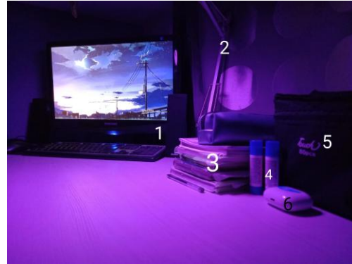
Мое рабочее место после использования 5С

Рабочий стол: 1. компьютер, 2. настольная лампа, 3. тетради и учебники, 4. клей, 5. маркеры.